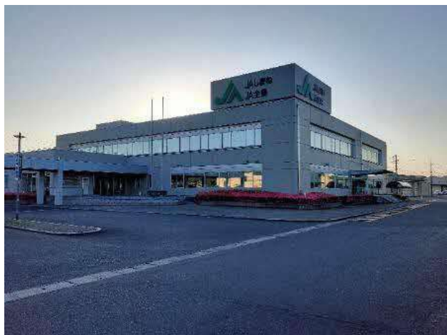
経営相談窓口 外観

受付時間：月曜日～金曜日（年末年始・祝日を除く） 9：00～12：00 13：00～17：00